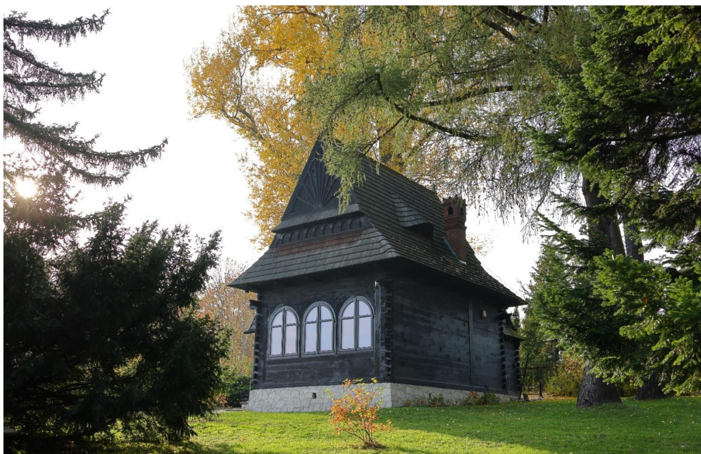
Muzeum Stefana Żeromskiego, Ul. Stefana Żeromskiego 8, Nałęczów