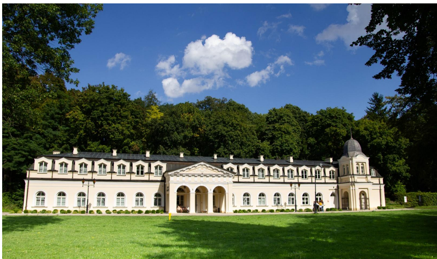
Stare Łazienki, Aleja Grabowa 4, Nałęczów

Po śniadaniu, czas na spacer po słynnym Parku Zdrojowym stanowiącym serce miasteczka, w którym bije źródło Miłości . Owe serce jest pełne zabytków, urokliwych alejek oraz historycznej architektury. Wchodząc do parku od ulicy Lipowej wita Cię gmach Pałacu Małachowskich , dawna rezydencja założycieli uzdrowiska. Idąc dalej docieramy do Pijalni Wód Mineralnych połączonej z Palmiarnią oraz Pijalnią Czekolady Wedel. Wychodząc z pijalni tuż obok widzisz kompleks wodny Atrium , a więc czas na chwilę relaksu w SPA. Zregeneruj ciało i umysł poddając się zabiegom, masażom i kąpielom zdrowotnym. Po tych przyjemnościach pora na dalszy spacer alejkami parku. Koniecznie zwróć uwagę na Stare Łazienki oraz staw z wysepką.