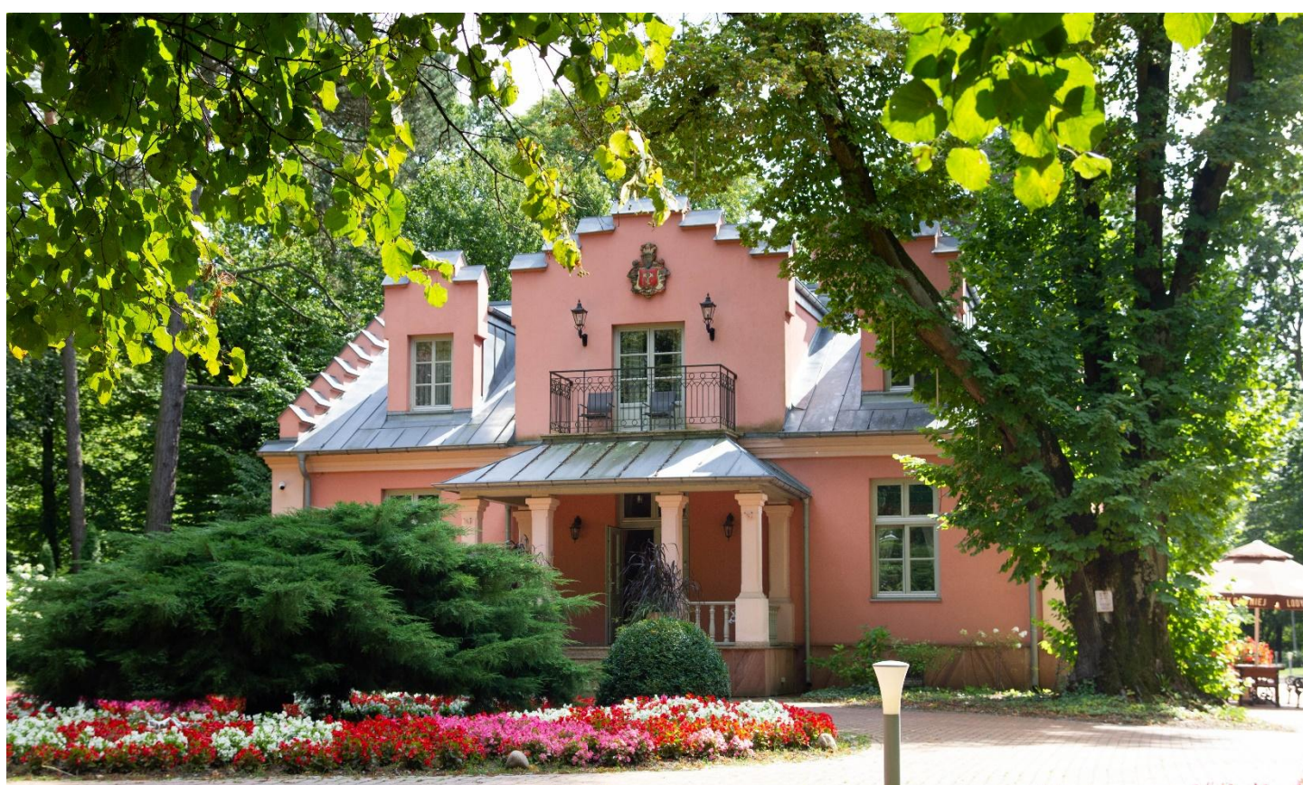
Willa Różana, Ul. Lipowa 8, Nałęczów

Dzień warto rozpocząć w jednej z kawiarni w centrum Nałęczowa. Jeżeli lubisz klimatyczne miejsca z nutą stylu, polecamy Restaurację w Willi Różanej , która serwuje pyszne, domowe wypieki i aromatyczną kawę. Śniadanie na świeżym powietrzu, w otoczeniu zieleni lub w przytulnym wnętrzu kawiarni, pozwoli Ci zanurzyć się w przyjemnej atmosferze spokojnego uzdrowiska.