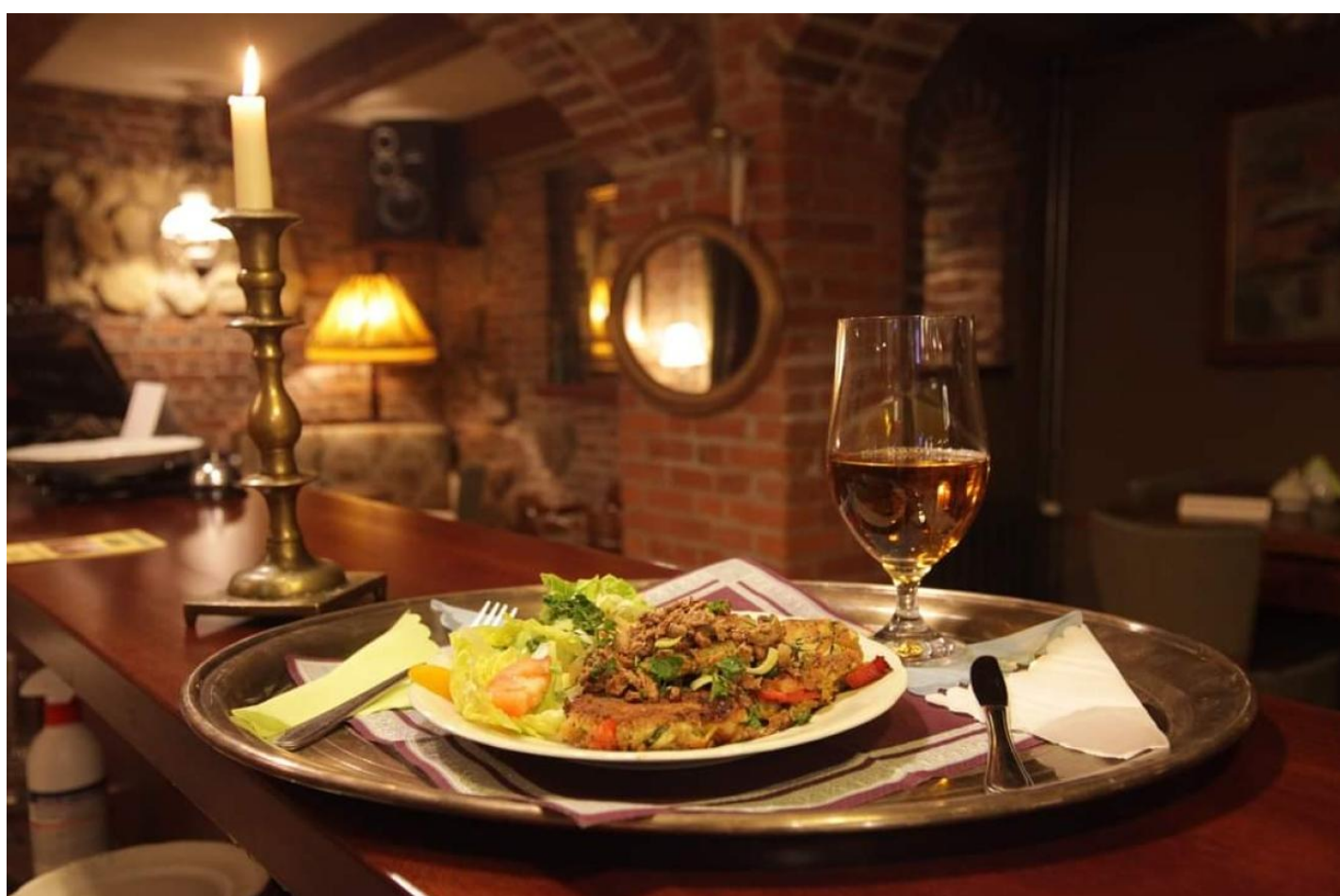
Restauracja Zabytkowe Podziemia, Ul. Lipowa 27, Nałęczów

Warto podsumować ten dzień kolacją w unikalnej Restauracji Zabytkowe Podziemia . Restauracja zlokalizowana w centrum Nałęczowa, mieści się w stylowych piwnicach Willi „Nadgórze”. Lokal jest elegancko urządzone i ozdobiony dziełami uznanych miejscowych artystów. Serwowane są tu autorskie dania, które niegdyś cieszyły się uznaniem odwiedzających miasto twórców. Możesz tam delektować się potrawami w połączeniu z dobrym winem, kończąc swój pobyt w Nałęczowie w nastrojowej atmosferze.