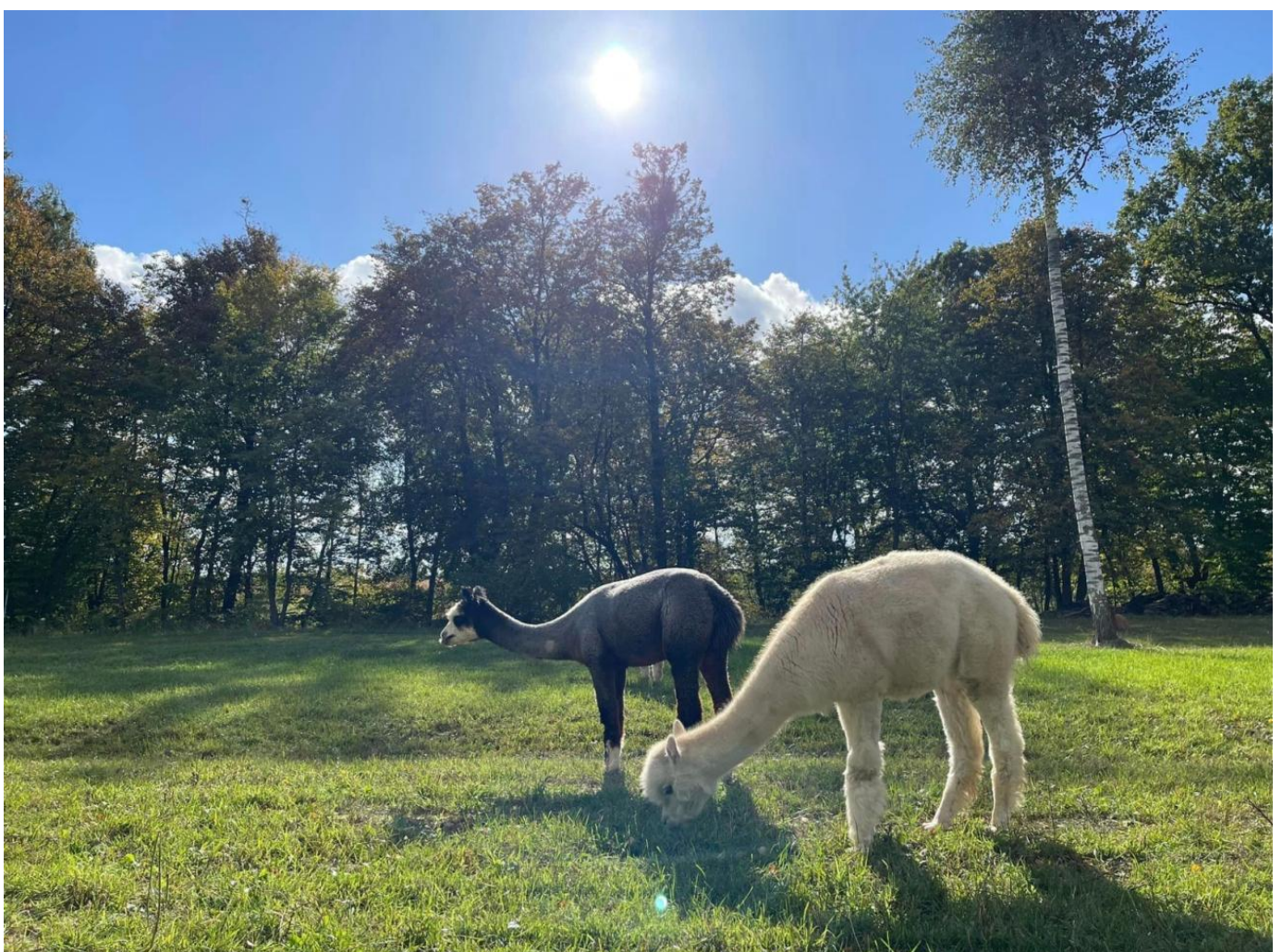
Nowy Gaj 8, Wojciechów

AlpakaRosa to hodowla alpaki i miniaturowych osiołków, położona w malowniczym Nowym Gaju, niedaleko Nałęczowa i Wojciechowa. Podczas wizyty goście mogą poznać zwyczaje alpaki i wziąć udział w ich karmieniu. Hodowla oferuje także możliwość zakupu wełny oraz wyrobów z runa alpaki. Dodatkowo, AlpakaRosa organizuje indywidualne spacerunki z alpakami i osiołkami po pobliskim Wąwozie Lipcyk.