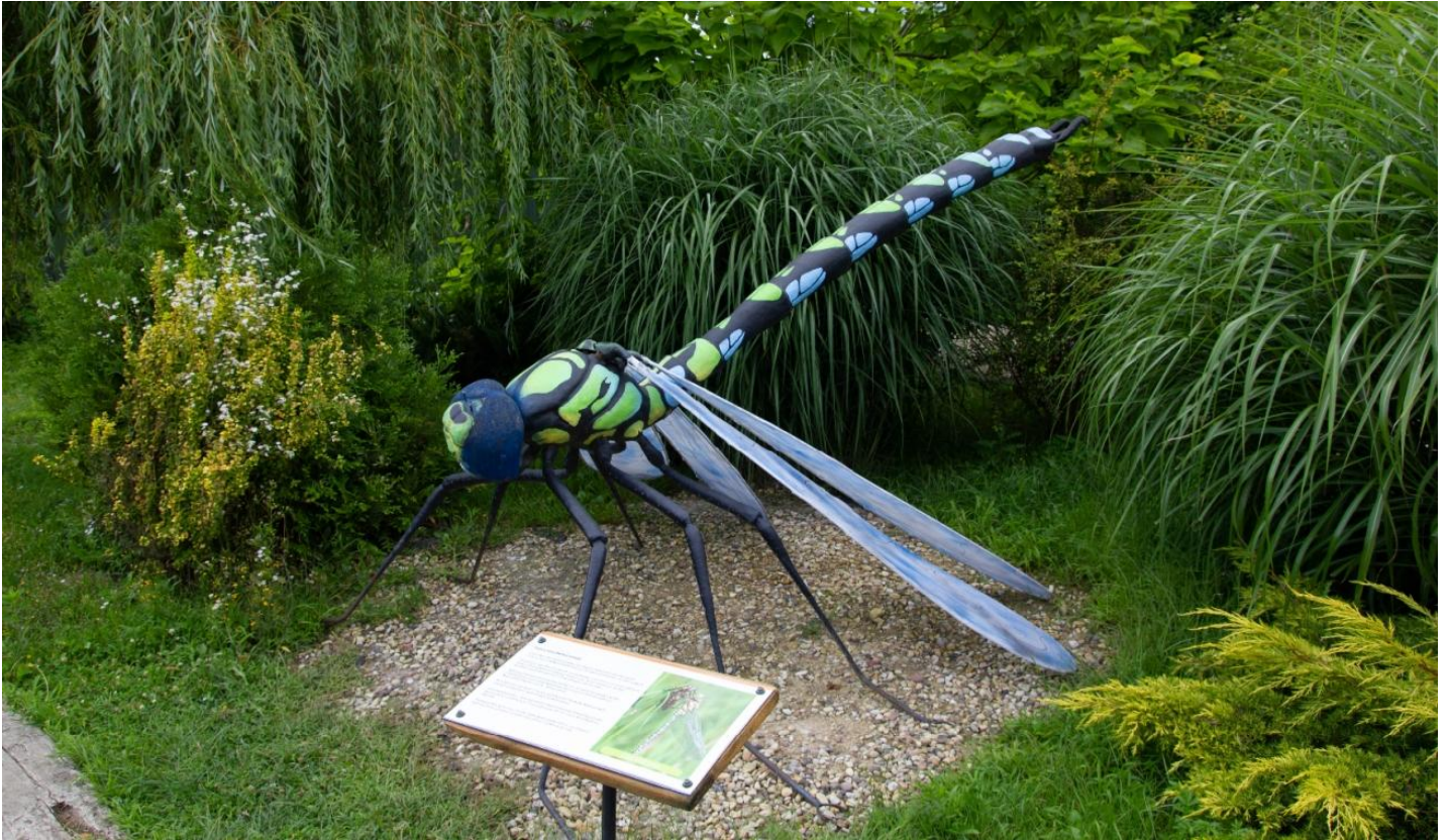
Wojciechów Kolonia Piąta nr 127