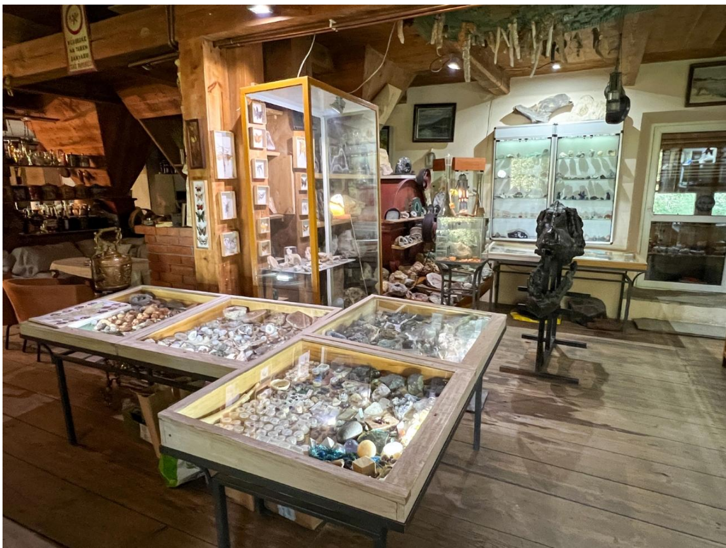
Nowy Gaj 18 a, Wojciechów

W Nowym Gaju, małej miejscowości blisko Nałęczowa i Wojciechowa, położony jest młyn, który kryje we wnętrzu Muzeum Mineralów, Meteorytów i Skamieniałości . Na chwilę obecną liczy około 5 tys. eksponatów. Dla chętnych organizowane są wycieczki naukowe oraz edukacyjna gra terenowa, w trakcie której uczestnicy mają okazję zapoznać się z geologiczną budową regionu. Muzeum oferuje warsztaty zarówno dla dzieci, jak i dorosłych, a wyjątkową atrakcją są zajęcia astronomiczne w planetarium Gemini oraz nocne obserwacje nieba za pomocą teleskopu. Na terenie muzeum można również zobaczyć „ aktywny wulkan ” – makietę wulkanu, z której wydobywa się prawdziwy ogień i wulkaniczne pyły.