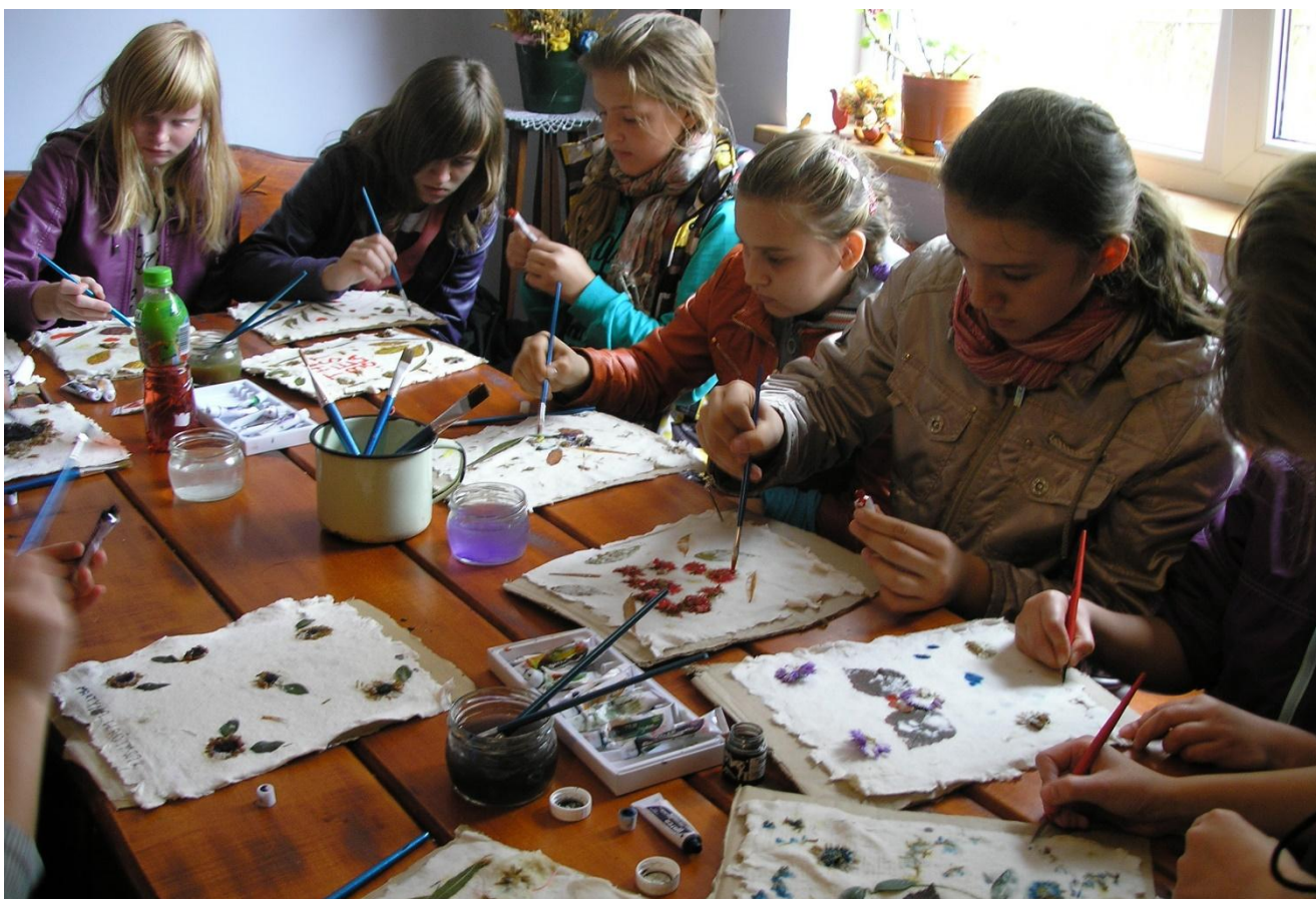
Celejów 72 a, Wąwolnica

Mała Papiernia – pracownia ginących zawodów organizuje interesujące warsztaty artystyczno-edukacyjne, mające na celu przekazanie wiedzy i umiejętności w zakresie produkcji papieru czerpanego oraz jego kreatywnego wykorzystania. Warsztaty papiernicze organizowane są z wykorzystaniem zabytkowych, oryginalnych narzędzi. Dodatkowo w ofercie znajdują się zajęcia z bibułkarstwa, tworzenia kwiatów z papieru, stroików świątecznych oraz palm wielkanocnych, inspirowane lokalnymi wzorami i technikami. Warsztaty odbywają się w odnowionej świetlicy wiejskiej. Obiekt otacza ogrodzony, dobrze zagospodarowany teren z plenerową sceną i galerią prezentującą historię Celejowa oraz papiernictwa.